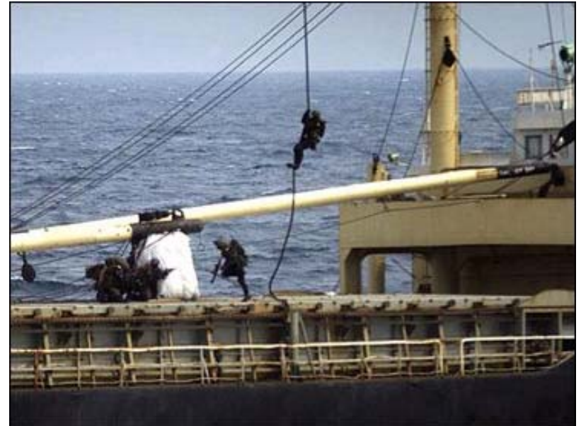
Spanische Eliteeinheiten entern den nord-koreanischen Frachter Sosan, 10.12. 2002